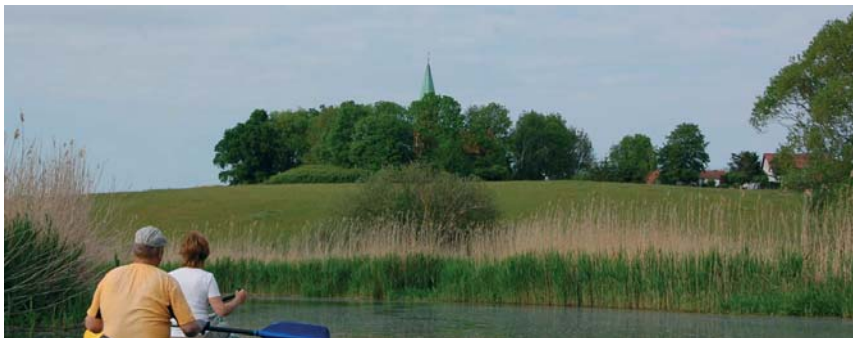
Die Radfahrerkerkirche Pantlitz von der Recknitz aus gesehen

Pfingsten 2006 eröffnete die Radfahrerkerkirche das erste Mal ihre Türen für die heutige Bestimmung. Am Ende der diesjährigen Saison am 25. September um 14 Uhr wollen wir dankbar zurückblicken und nach einer Andacht auch Zeitzeugen befragen und einen Bilderrückblick zeigen.