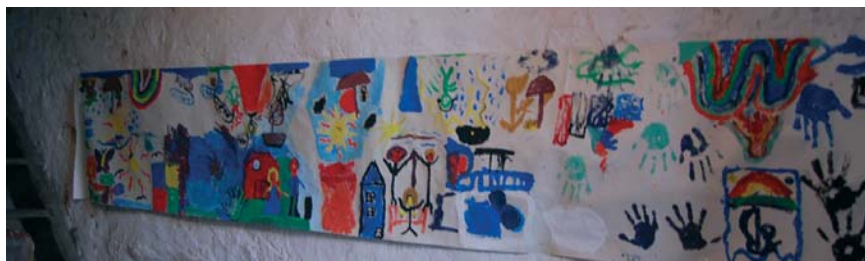
Kunstwerke entstanden beim Kindermusikprojekt in Schlemmin