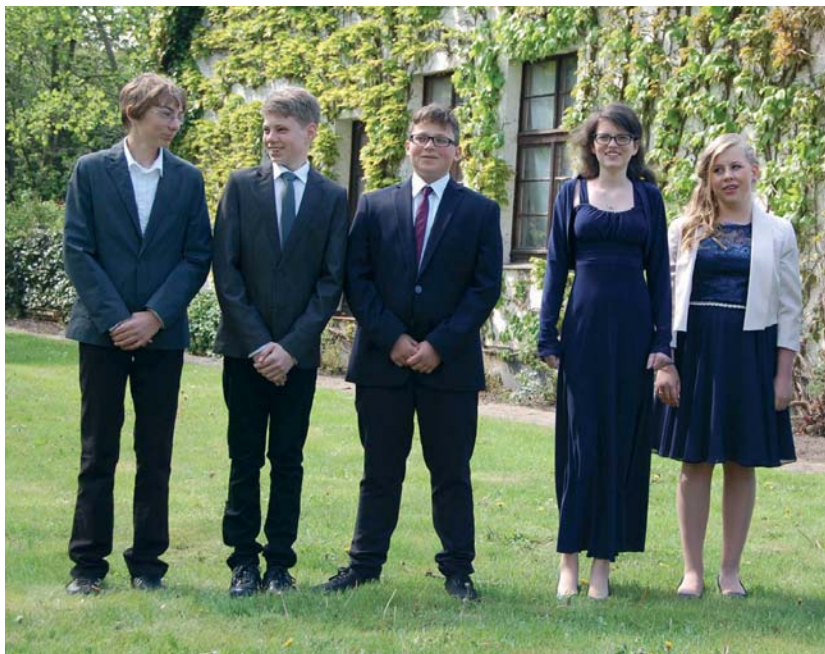
Die erleichterten Konfirmanden nach dem Festgottesdienst.